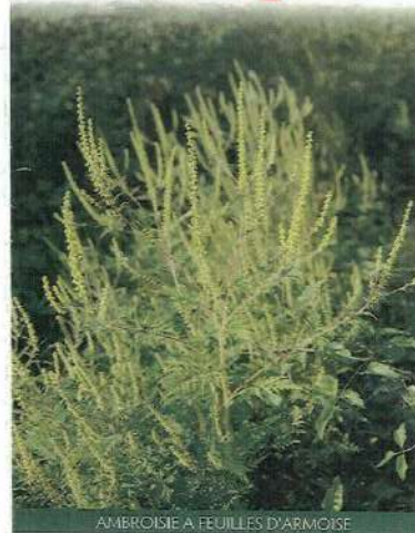
AMBROSIE A FEUILLES D'ARMOISE