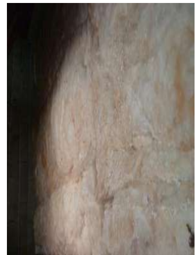
Isolation des combles perdus