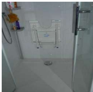
Adaptation de la salle de bain