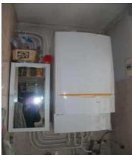
Remplacement de chaudière