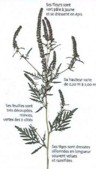
AMBROSIE EN FLEUR