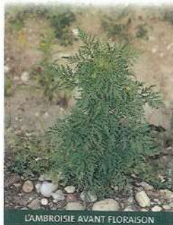
L'AMBROSIE AVANT FLORAISON