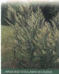
ARMOISE VULGAIRE EN FLEUR

Observatoire des ambrosies, d'après DIDAS Flore