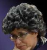
GERALDINE, mère suspicieuse de Nick