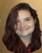
SIPHETTE, femme de bonne compagnie