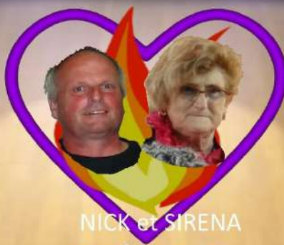
NICK et SIRENA couple en crise...