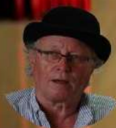
HERCULE, détective à la retraite